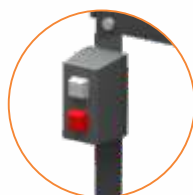
Llave del motor