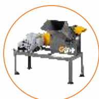
JF 30P con motor acoplado