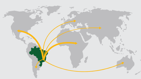
DESDE BRASIL PARA MÁS DE 50 PAÍSES EN TODOS LOS CONTINENTES