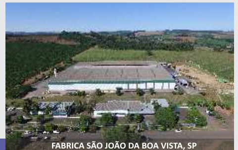
FABRICA SÃO JOÃO DA BOA VISTA, SP

Línea de Maquinaria Estacionaria JF, la solución para el ganadero!