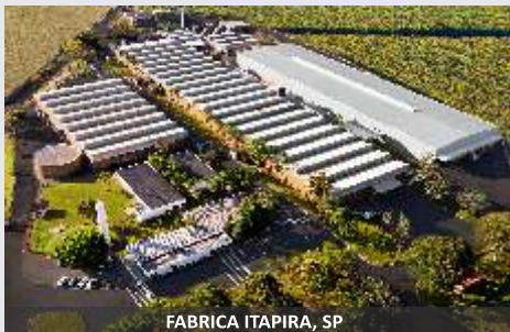
FABRICA ITAPIRA, SP

La más productivas y confiables del mercado!