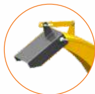
Deflector JF 40P