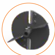
Rotor JF 30P