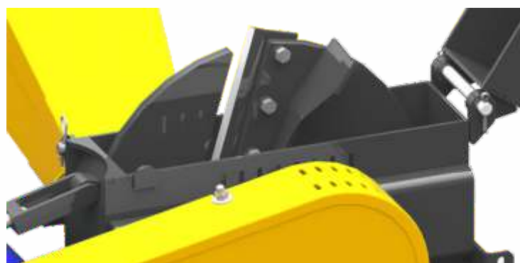
Cuchilla de la picadora JF 40P