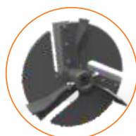
Rotor JF 40P